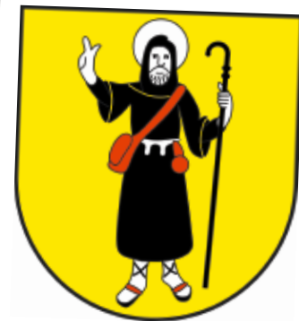
Das Wappen von Sagogn zeigt den heiligen Kolumban.

... am 3. Februar der Pilgerstamm des Vereins Jakobsweg Graubünden stattfindet? Im Restaurant No Name, hinter dem Bahnhof Chur, ab 18 Uhr. Kontakt: Vreni Thomann, 081 630 31 17. Eine Neuheit in diesem Jahr ist eine Pilgeretappe auf dem Kolumbanweg , die von Irland, England und Frankreich durch die Nord- und Ostschweiz/Graubünden nach Bobbio (Italien) führt. Der neue Weg nennt sich nach dem Wandermonch Kolumban und erinnert an seine Missionierung des Bodenseeraumes im 6. Jahrhundert.