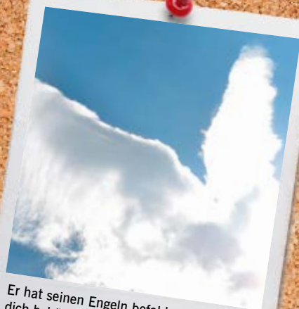
Er hat seinen Engeln befohlen, dass sie dich behüten auf allen deinen Wegen. (Ps 91,11)

... wir am Sonntag, 2. Februar , das Fest Darstellung des Herrn feiern? Es ist der 40. Tag nach Weihnachten, der volkstümlich auch Mariä Lichtmess genannt wird. Das Fest geht auf das 4. Jahrhundert zurück. Am Nachmittag von Mariä Lichtmess wird vielerorts der Blasiussegen gespendet. Der Gedenktag des hl. Blasius ist der 3. Februar. Seit 1997 ist der 2. Februar auch der Tag des geweihten Lebens .