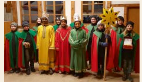
La gruppa dils Retgs da Laax 2020

possibilitar il cant dils Retgs e la sentupada denter convischins els quartiers dil vitg. Cordialmein engraziem nus era a tuts donaturs per il sustegn generus da CHF 1400.– en favur d'affons en pitgiras.