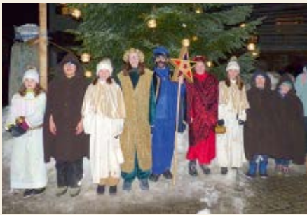
La grupp dils Retgs da Falera 2020

Cordialmein engraziein nus era a tuts donaturs per il sustegn generus da CHF 1100.– en favur d'affons en pitgiras.