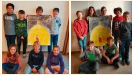
Scolar(a)s da Falera/scolar(a)s da Laax

Il fegl giuven ha schau emplenir la sala mo cun ina candeila. La sala ei vegnida emplenida dil tuttatfatg cun glisch e la regina ha tscherniu el sco siu successur. Pertgei il messadi ei sempels: Glisch el stgir emplenescha nos cors. Ei drova aschi pauc per esser ina glisch per nos concarstgauns.